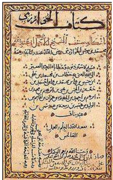
A page from Al-Khwarizmi's ALGEBRA