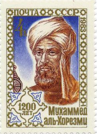
A stamp issued September 6, 1983 in the Soviet Union, commemorating al-Khwarizmi's (approximate) 1200th birthday

సోవియట్ యూనియన్ సెప్టెంబర్ 6, 1983లో అల్-ఖ్వారిజ్మి 1200వ పుట్టిన రోజు సందర్భంగా విడుదల చేసిన పోస్టల్ స్టాంప్